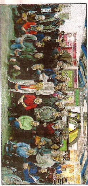
■ 120 bénévoles ont participé au bon déroulement de cette exposition.